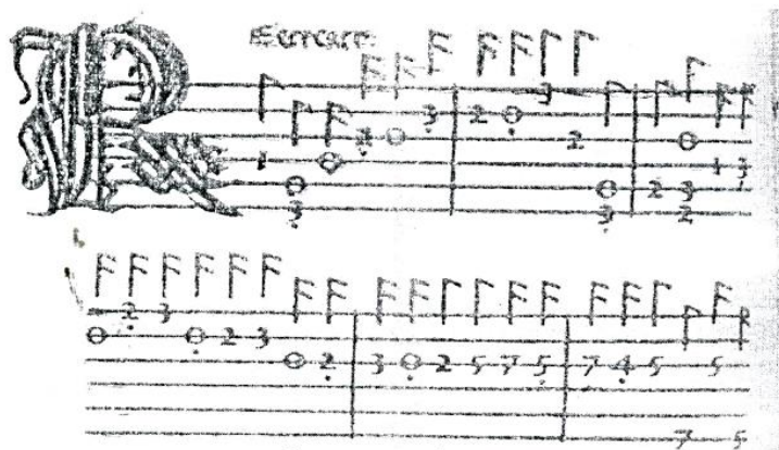
Лютня табулатураси Италия 1507 йил

Фақатгина XVII аср бошларига келиб бундай табулатуралар ўрнини ҳақиқий нота ёзуви эгаллай бошлади. Шунини ҳам айтиш мумкин XVII-XVIII асрларда Европа мамлакатларида қўлланилган нота ёзуви системаси ҳозирги кунда жаҳон мамлакатларида фойдаланилаётган нота ёзувигача асос бўлди., даслаб у ҳозирги даражада мукаммал эмас эди. Ҳозирги нота ёзув системаси асосан XIX аср охири ва XX аср бошларига келиб тўла мукаммаллашиб бўлди. Замонавий нота ёзувининг мукаммаллашувида Петербург ва Москва консерваториялари профессорлари Николай Яковлевич Мясковский (1881-1950) ва бошқаларнинг хизматлари бор.