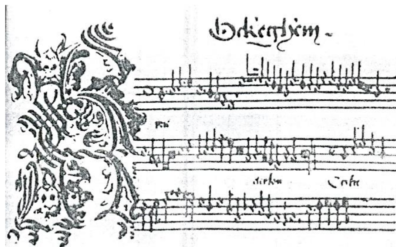
Мензура нота ёзуви 1500 йил

Фақатгина XVII аср бошларига келиб бундай табулатуралар ўрнини ҳақиқий нота ёзуви эгаллай бошлади. Шунини ҳам айтиш мумкин XVII-XVIII асрларда Европа мамлакатларида қўлланилган нота ёзуви системаси ҳозирги кунда жаҳон мамлакатларида фойдаланилаётган нота ёзувигача асос бўлди., даслаб у ҳозирги даражада мукаммал эмас эди. Ҳозирги нота ёзув системаси асосан XIX аср охири ва XX аср бошларига келиб тўла мукаммаллашиб бўлди. Замонавий нота ёзувининг мукаммаллашувида Петербург ва Москва консерваториялари профессорлари Николай Яковлевич Мясковский (1881-1950) ва бошқаларнинг хизматлари бор.